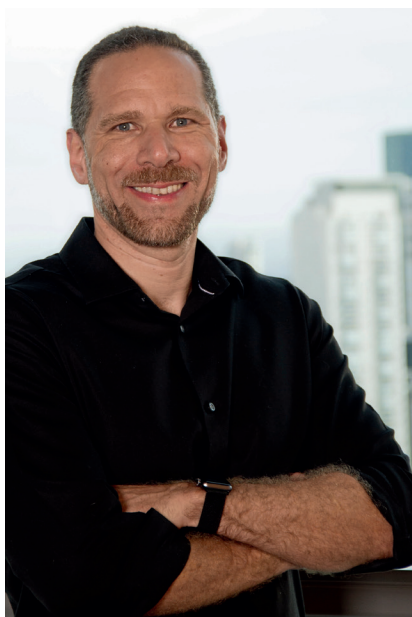
Alex Szapiro Presidente, Amazon do Brasil

Visite o site fmcsv.org.br/pt-BR/gptw e leia o depoimento de cada um deles sobre as experiências que viveram na primeira infância e que consideram fundamentais para a construção de quem são hoje.